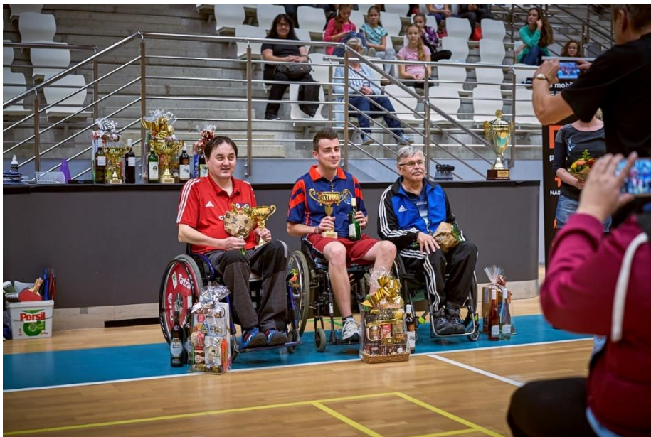
Trojice nejlepších skupiny B v roce 2018