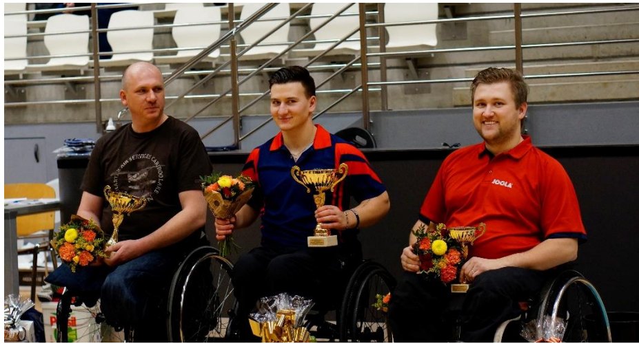
Trojice nejlepších skupiny A v roce 2018