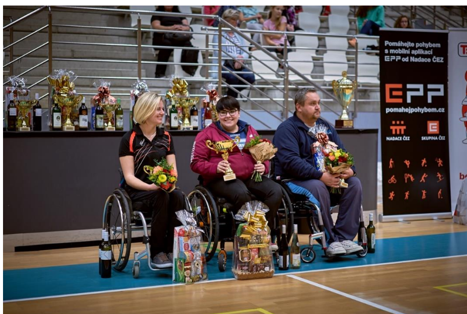
Trojice nejlepších skupiny C v roce 2018